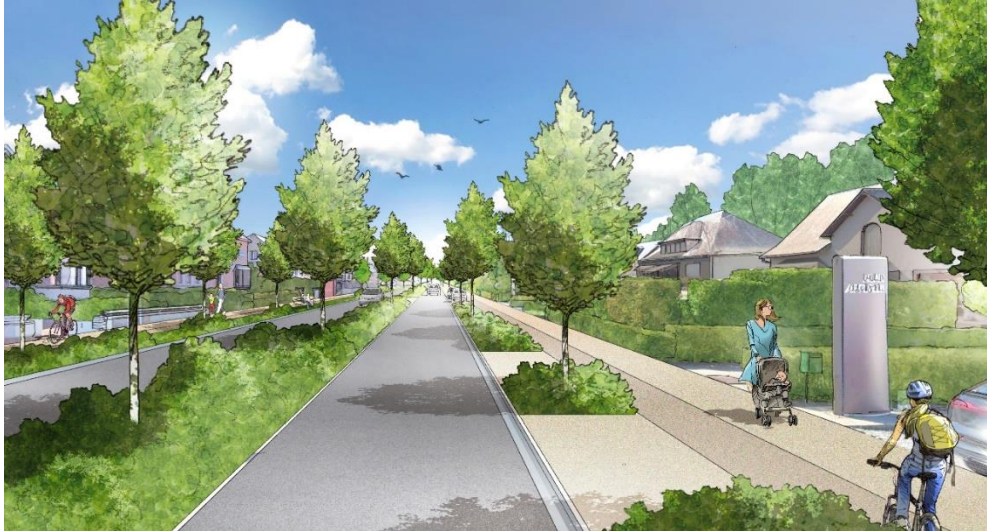
Illustration du réaménagement de l'Avenue Schlögel en Boulevard urbain

suppression du passage à niveau de Leignon. Les travaux ont débuté pendant l'été 2023. A terme, il pourrait également être possible pour la Ville de se doter d'une liaison entre Halloy et Ciney (déjà évoquée au sein du PCM), entre Chevetogne et Leignon et entre le RAVeL et la gare de Ciney.