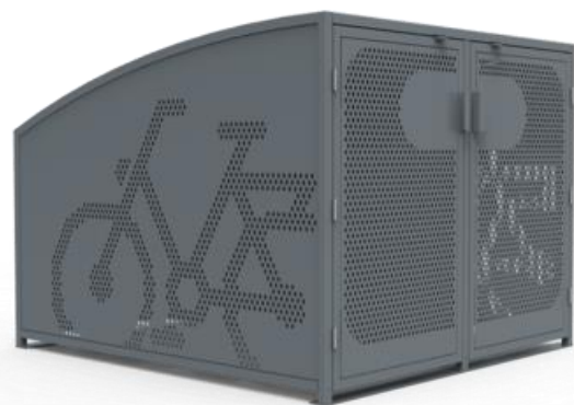
Exemple de Box vélo

Ces box permettent par exemple d'entreposer son vélo électrique - plus coûteux - de manière sécurisée, en toute tranquillité. Ce type de solution de stationnement pourrait par exemple être installée dans une gare, sur un parking de covoiturage ou encore dans le centre-ville.