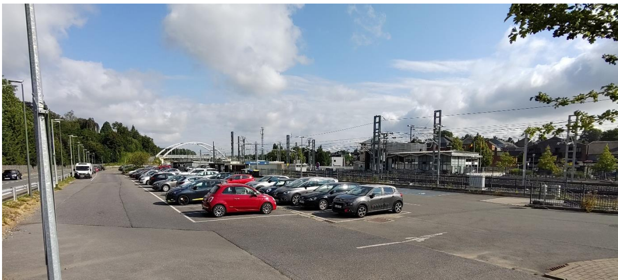
Parking de la gare de Ciney

Exemple d'emplacement où les équipements pourront être installés.